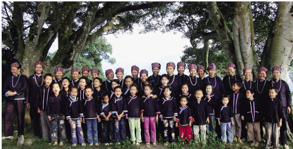
富宁县壮族沙支系浓越分支的妇女和儿童服饰

文山州壮族沙支系，自称有布依、布雅依、浓越等。其中，布雅依、浓越主要分布在富宁县，布依分布在丘北县，虽然两地的壮族都操壮语北部方言，但是，两县的壮族沙支系不能相互对话。丘北县的布依保留传统文化较多，富宁县的布雅依、浓越保留的传统文化相对较少。富宁地区壮族传统服饰基本汉化，而丘北地区的壮族传统服饰丰富多彩，独具地方特色。数百年来，富宁壮族传承的壮剧，是壮汉文化融合发展的结晶，到1950年，富宁县的土戏班，即壮剧戏班有150多个，演员8000多人。壮剧是用壮语和汉语演唱，剧目有古代战争题材，也有壮族传统民间故事作为题材的。富宁县与广西壮族自治区接壤，其壮族传统文化与广西属同一个文化带，这一文化带与广南、砚山、文山、马关、西畴、麻栗坡县直至越南的浓依文化带，有明显的区别，如浓依传承壮族原始宗教“摩教”，而富宁壮族传承壮传道教和壮族原始宗教。