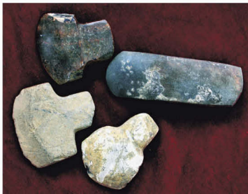
麻栗坡县出土的双肩石器——石镑