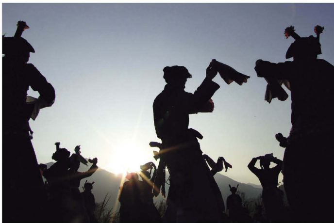
壮族村民在表演祭祀“砍法”（刀）舞

舞“摆巴”和“老洛少叩凡”应是壮族先民进入狩猎、稻作农耕时代的历史遗存，是壮族先民开创稻作文化的回光再现。贵马村壮族铜鼓舞，更进一步说明壮族对“砍法”新石器大石铲的崇拜。