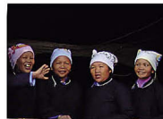
富宁壮族濮依支系服饰