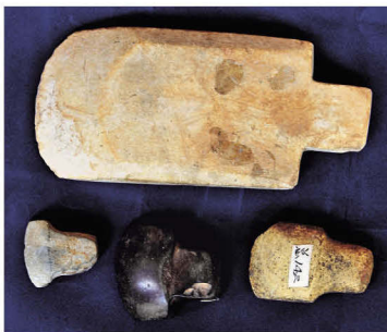
西畴县出土的双肩石器——石铲

贵马村传承的12部分壮族铜鼓舞中，第一部分壮语称“当叩”，“当”为“站立”；“叩”为“膝”。舞蹈内容展示先民已立膝行走，渐渐脱离禽兽界的生活方式，开始向文明的人类行进。第二部分壮语称“摆巴”，“摆”意为“祭祀”；“巴”为“刀具”。内容展现的是远古壮族先民崇拜“砍法”并祭祀“砍法”这类刀具的舞蹈，再现了先民祭祀赖以生存的“砍法”及相关民俗活动。第三部分，壮语称“老洛少叩凡”。“老洛”意为“开辟道路”；“少叩凡”指“撒稻谷种”。铜鼓