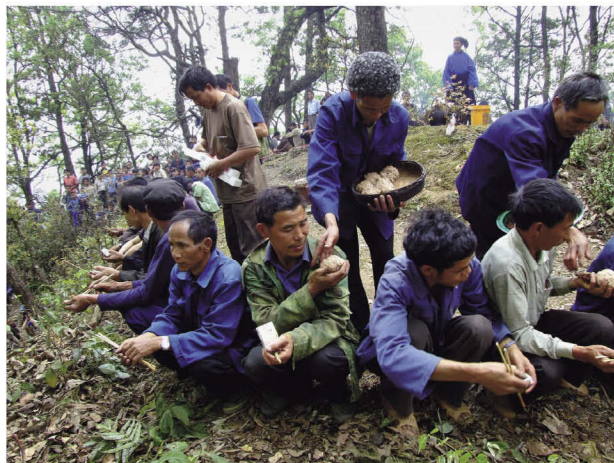
广南县壮族在祭祀始祖“乜闾”时，将神谷做的糯米饭供品平分给各宗族的族长