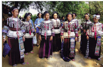
丘北县壮族沙支系布依分支妇女服饰