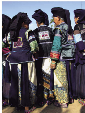
布傣支系中的榕洪土分支服饰