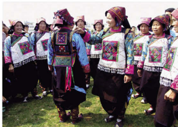
布傣支系中的平头土分支服饰