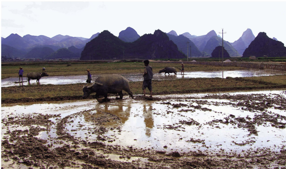
文山壮族现代农耕场景

父系氏族社会后期，由于人口的增加和生活地域的扩展，许多独立的父系家庭聚居成村落“版”、“隆”。随着“版”、“隆”的增多，原来的“博𠵼”变为“博版”（部落酋长），壮族社会又进入了第