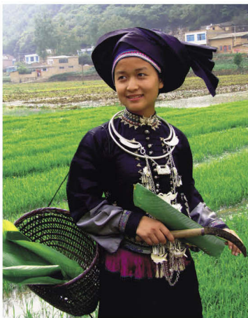
西畴县壮族依支系服饰

土支系自称有“布傣”、“濮岱”。土支系按头帕缠绕的方式不同，分为“尖头土”、“平头土”、“搭头土、偏头土”三四个小分支，操壮语南部方言，人口约有15万人，约占全州壮族人口的10%至20%，主要分布在文山、砚山、马关三个县。