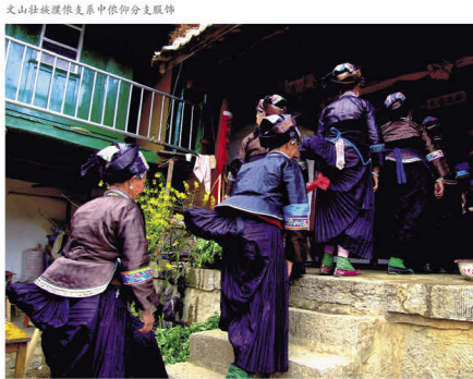
文山壮族濮依支系中依仰分支服饰