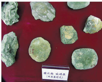
旧石器时代的燧石、燧磁器

在文山州境，不仅在黑箐龙洞发现旧石器，在马关九龙口仙人洞及麻栗坡、广南、西畴等地区也发现有旧石器。