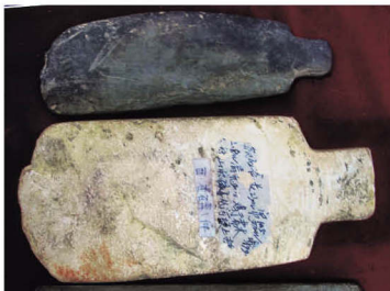
马关县出土的双肩石器——石铲