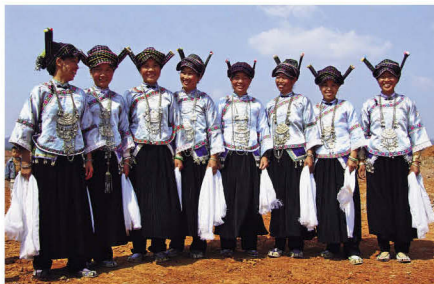
依道表演于中甸时的服饰

历经数千年的社会发展、演变，“濮依”定居的地域不同，服饰、语言、自称亦有变异，人们以地域命名来称呼族群。广南县依语称“劬督”，西畴、麻栗坡、文山、砚山县各县的“濮依”，称广南县的“濮依”为“依道”。西畴县和麻栗坡县有一条河，依语叫“达仰”，人们称这条河流两岸居住的“濮依”为“依仰”。马关县及其与越南接壤