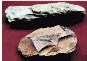
西畴仙人洞附近遗留的旧石器