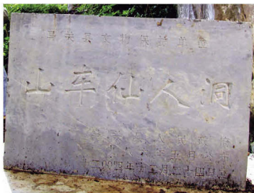
马关县人民政府立的文物保护单位