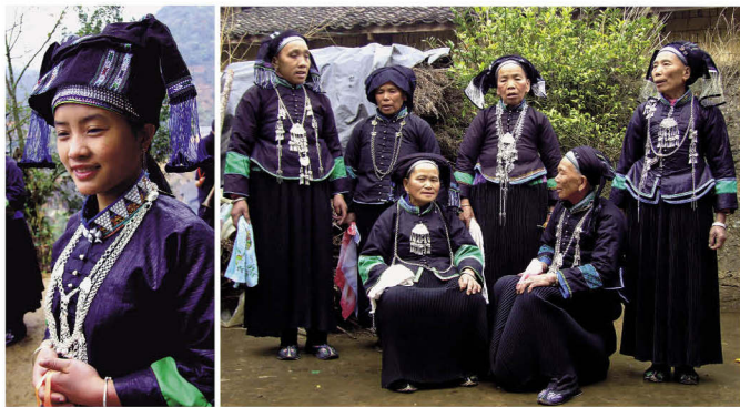
马关壮族濮依分支服饰