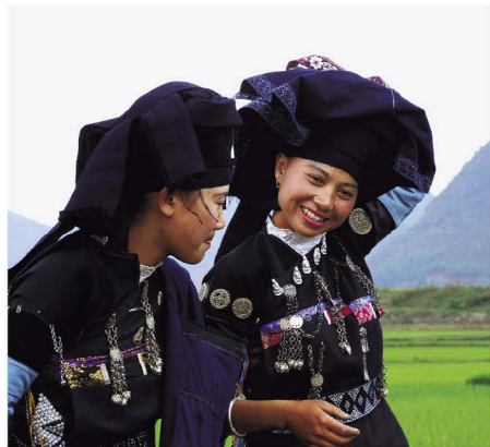
砚山县壮族土支系服饰