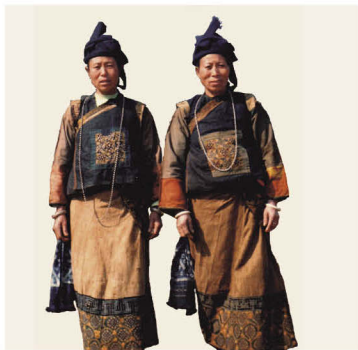
布傣支系中的偏洪土分支服饰

至今，壮族布傣支系定居的村落地名，都表明布傣支系在中国南方生息历史的久远。布傣母语对自己定居的村落地名都冠以“傣××”之称，如文山市牛头寨，布傣母语称“傣牟”；灰土寨称“傣抖”；喜得冲称“傣突保”。在文山州冠以“傣××”的地名有250个村。除文山州外，相邻的红河州冠以“傣××”的地名也有42个村，越南北部冠以“傣××”的地名有6个村。