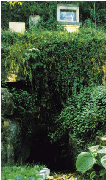
“西畴人”牙化石出土地——西畴仙人洞