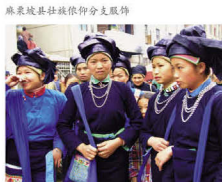
麻栗坡壮族濮依仰分支服饰