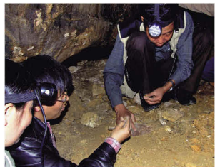
考古工作队在洞内发现古猿化石