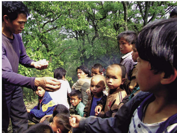
各宗族的族长将糯米饭供品平均分给12岁以下的儿童，这是原始共产时代爱护儿童的遗风