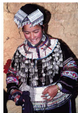
壮族沙支系布依分支新娘盛装