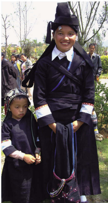
布傣支系中的尖尖土分支服饰