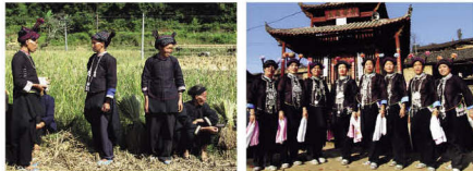
广南壮族濮依支系中依依（左）和依道分支服饰（右）