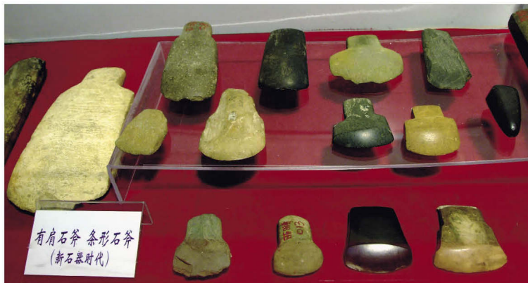
新石器时代的有肩石斧和条形石斧