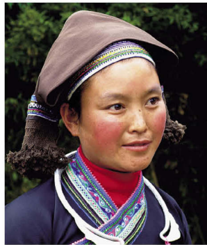
丘北县壮族沙支系服饰