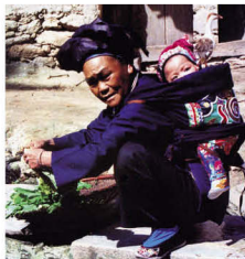
砚山县依仰分支服饰及背孩子用的背带

地区依语称“劬督”，这些地区的“濮依”被称为“依督”。“濮依”除了以地域命名族群名称外，也有以支系间的融合而称呼的，如广南县者兔地区的壮族“傣”（岱）支系曾经与“濮依”支系融合发展，这一地区的“濮依”自称就变为“依傣”。