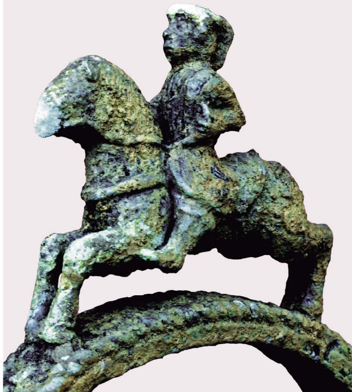
广南县牡宜句町贵族墓出土的西汉骑士提耳铜釜

当卢是一种放置在马额头前中央的马笼头装饰。此当卢出土于汉代句町古国政治、军事活动中心地区，专为战马佩戴挡兵器袭击马头用。挡兵器袭击器具亦为避邪物，为此，壮族先民在青铜当卢纹饰雕铸上下工夫。壮族崇拜鸟，在当卢正面雕四鸟，四只鸟昂首驱邪鸣叫，壮族崇拜鱼，人面以鱼的造型组成，鱼身作人鼻，鱼尾、鱼翅作人头发，给人产生似人非人、似鱼非鱼的视觉感。人面铸有上下皆为八颗凸起的铜牙。人面的眼睛为壮语称的“塔当”，即“怒目、凶目、仇目、锐目”。此当卢的纹饰，给人感觉威严神圣，已经达到驱邪避凶的视觉感。此当卢的“塔当”与三星堆出土的凸目器具有渊源可探，其艺术构思已达到最高境界。