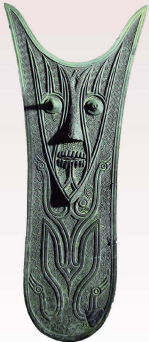
广南县普千村出土的西汉四鸟鱼形人面纹青铜当卢