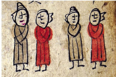
上：历算图局部；下：夫妻图