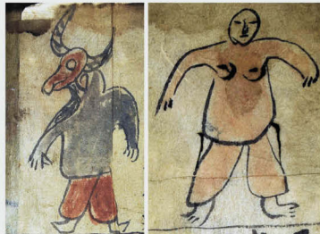
怪牛图、人物白描图