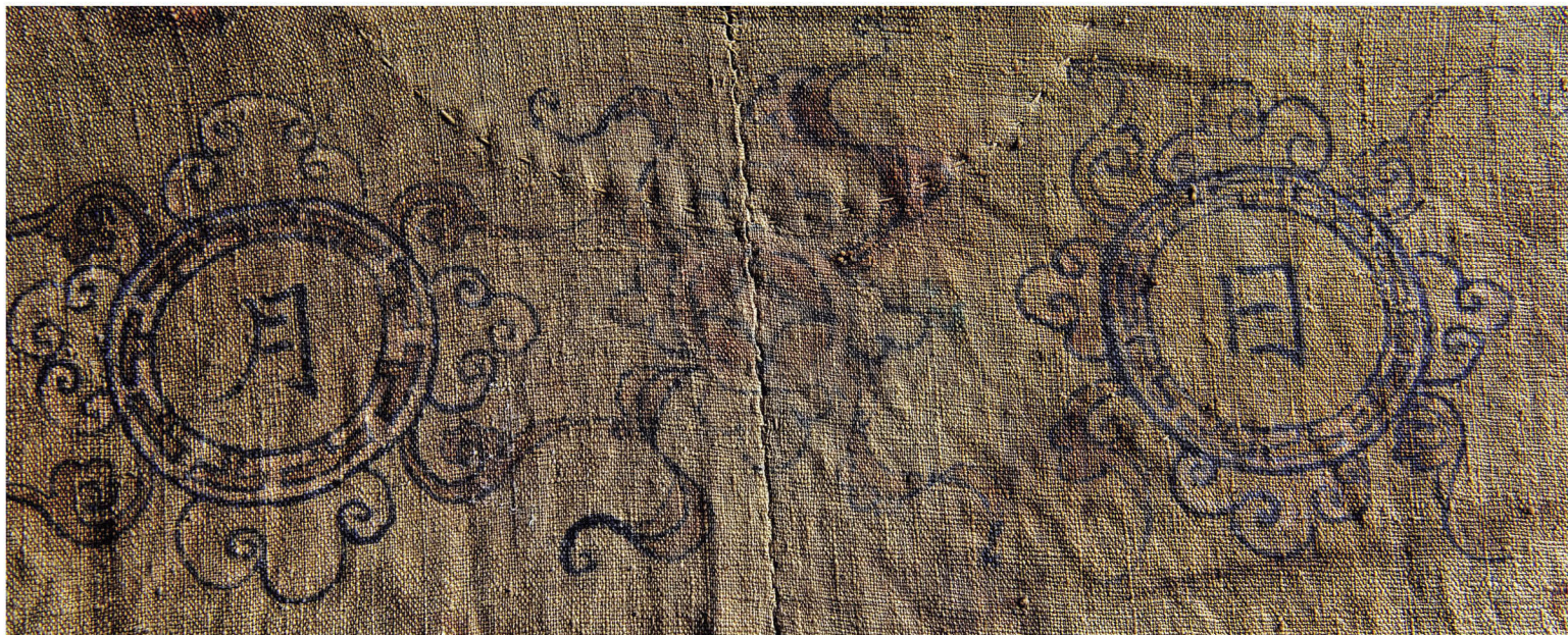
壮汉文化交融，日月高照，双湖雨顺