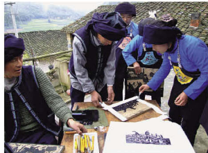
马关县民间版画作坊在制作纸画