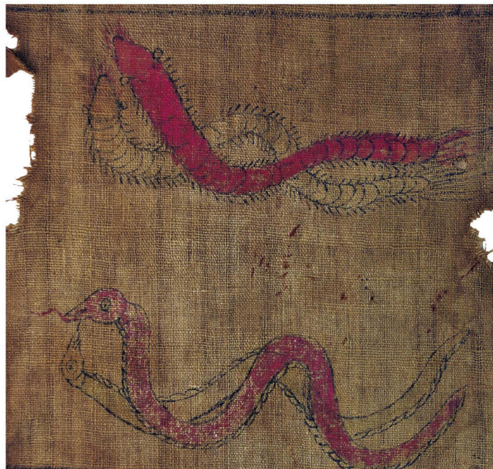
壮族古籍图谱记载，同物种异性交配繁衍后代是自然发展规律