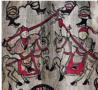
壮族古籍记载，人类必须和谐相处，不和谐便会招致战争