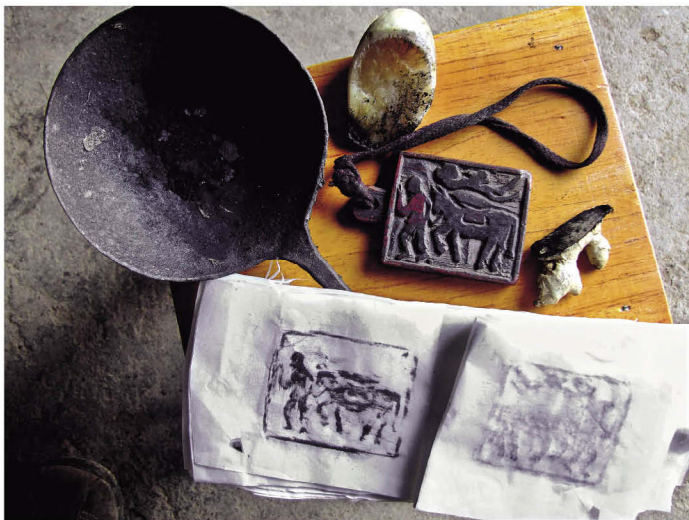
壮族宗教木刻符章印