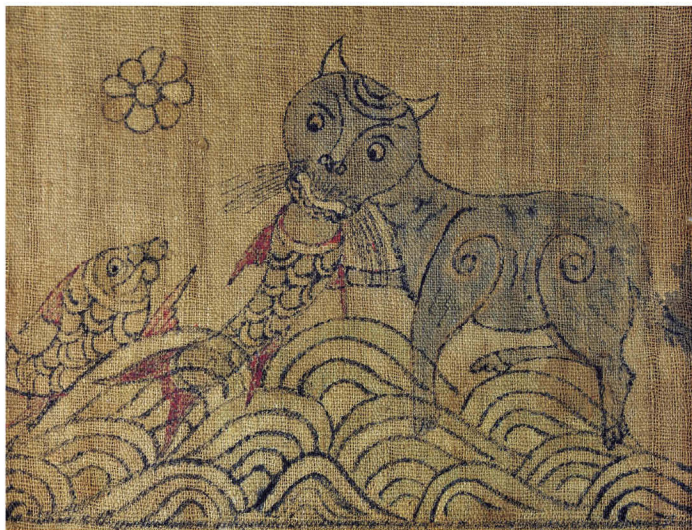
壮族古籍图谱记载，弱肉强食也是自然发展规律