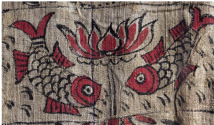
壮族古籍记载，万物分公母，鱼亦有公母