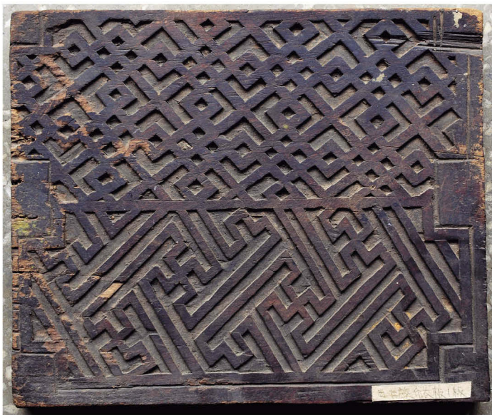
西畴县马卡村清代木刻版之一