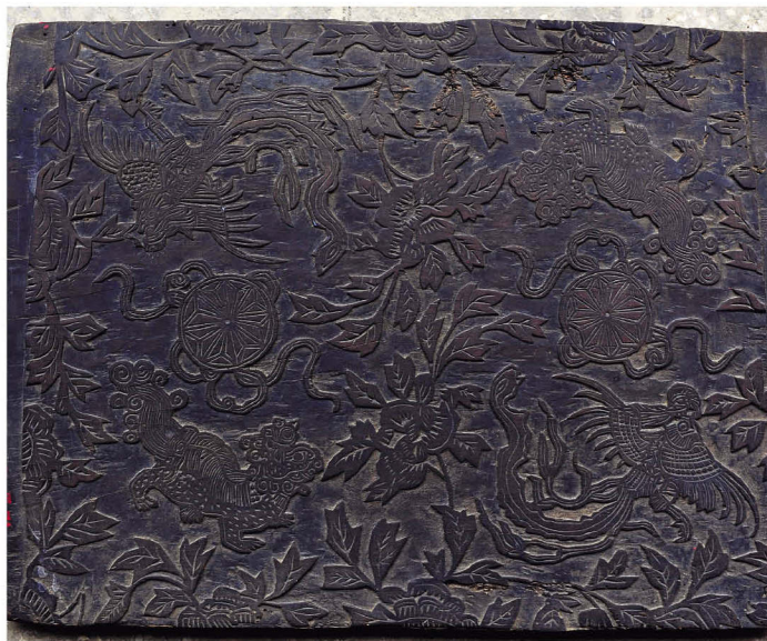
西畴县马卡村清代木刻版之二