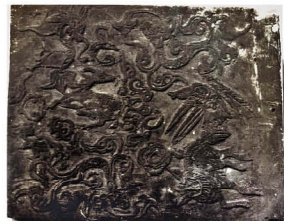
西畴县马卡村清代木刻版之三