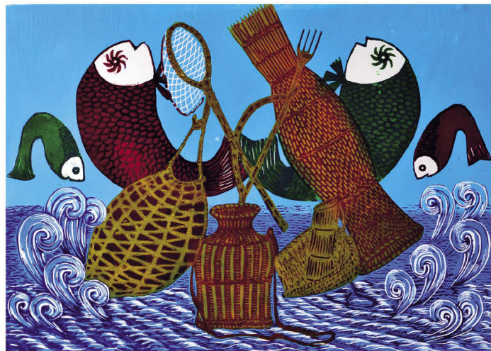
当代与关县民间版画作坊制作的版画（组图）