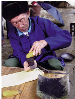
壮族摩教男祭司用黄瓜、萝卜或姜辣木的根捣碎锅灰于印上

壮族民间版画源于祭司使用的宗教符章，其历史悠久。可以说壮族先有符章木刻板，然后才有版画艺术的发展。在马关县仁和镇阿峨村，博摩至今仍然传承使用咒符章木刻板，同时村民也在发展自己的传统木刻板画。在清代，马关县仁和镇的仁和街曾经建有木刻板画印刷作坊，作坊印刷的书籍流传很广，笔者在西畴县征集到一本该作坊在清代光绪九年印刷的《玉历抄传》，书本内页多数是木刻板画作品。