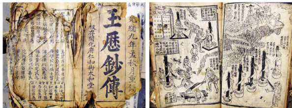
清代马关县仁和街作坊木刻版印刷书