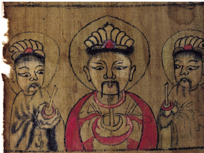
古籍西语社传道教图