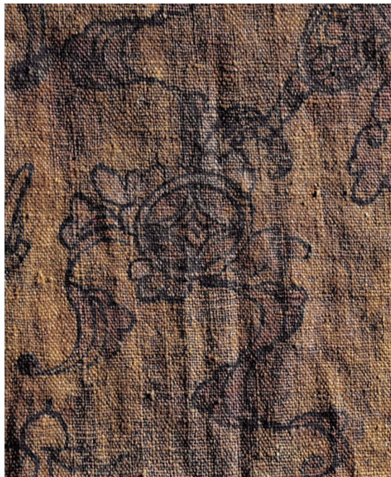
壮族将太阳图案和古钱币图案双重构图，表示光明富贵之意