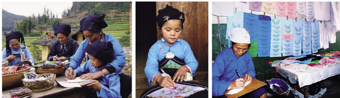
壮族“莱瓦”艺术传承人在传承技艺