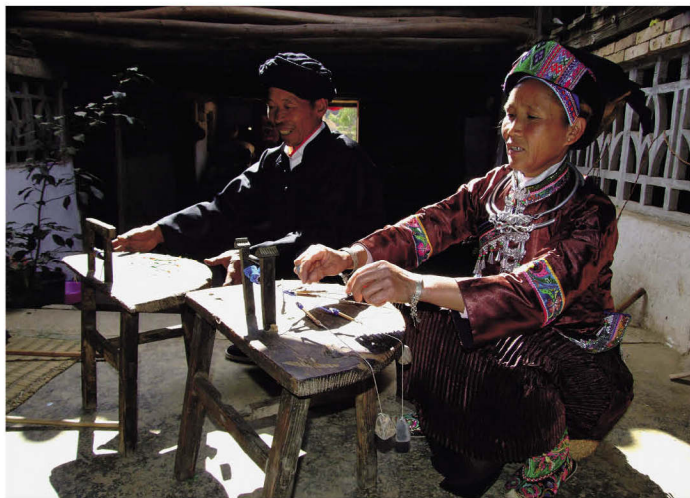
壮族传统服饰制作需要大量的丝织彩带，彩带是用蚕丝染色后在编织彩带器具上用手工编制。图为文山市迈勒湾村壮族夫妇在编织彩带

壮族自古就十分重视育婴护子，凡是女儿出嫁后生小孩，一旦小孩满月，外婆家必须组织亲族履行送背带给新生婴儿的仪式，为此，壮族的绣锦背带艺术得到传承。妇女们精心制作的背带，各自发挥“莱瓦”艺术才智，传承着丰富多彩的壮锦文化。