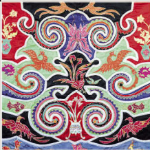
中期壮锦常带两性交媾图(组图)