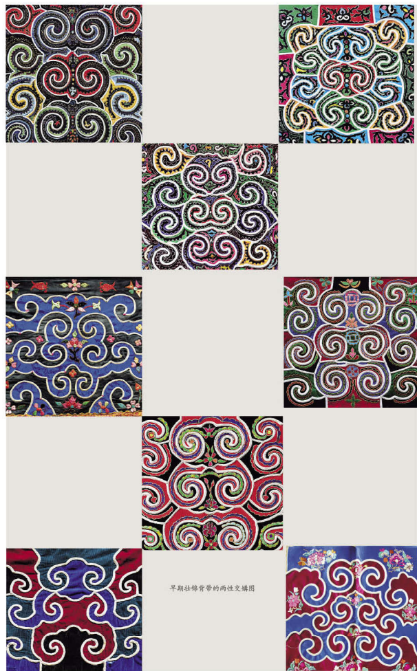
早期壮锦背带的两性交媾图