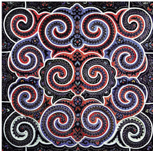
祈求人丁兴旺两性交媾图背带