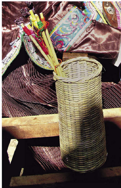
①② 文山壮族濮依支系妇女在织壮锦 ③ 织壮锦的妇女用竹萝装丝线