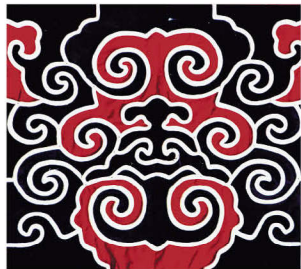
西畴上新民村壮锦图案源于石器时代的普格岩画的两性交媾图

早期壮锦背带类，这类构图可追溯到丘北县普格岩画的创作意图，普格岩画产生于新石器时代，那时的先民在恶劣的自然环境下与猛兽争生存，祈求人丁兴旺的欲望成为群体的核心思想，先民将这一思想绘成吉祥图在岩壁上。普格岩画初看是卷云纹，通过对比研究才发现，先民绘的是抽象的男女两性交媾图、生子图、人丁兴旺图，是当时的崇拜偶像。壮族早期壮锦背带的图案沿袭普格岩画的表现手法和构图理念，图案所表现的是祈求人丁兴旺的核心思想。