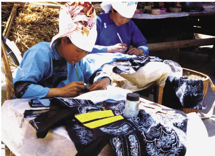
至今，广南许多壮族女性还穿着传统服饰。每逢集市，刺绣传承人都会到集市上绣传统刺绣图案，卖给会绣不会画的人。图为广南县田莫街刺绣传承人在画刺绣图案借卖