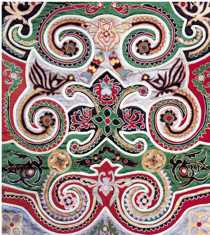
从早期发展到中期壮锦背带的两性交媾图