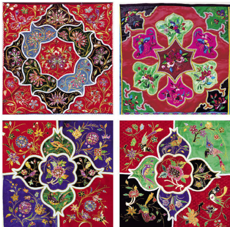
石坝“多子”棠林图（组图）