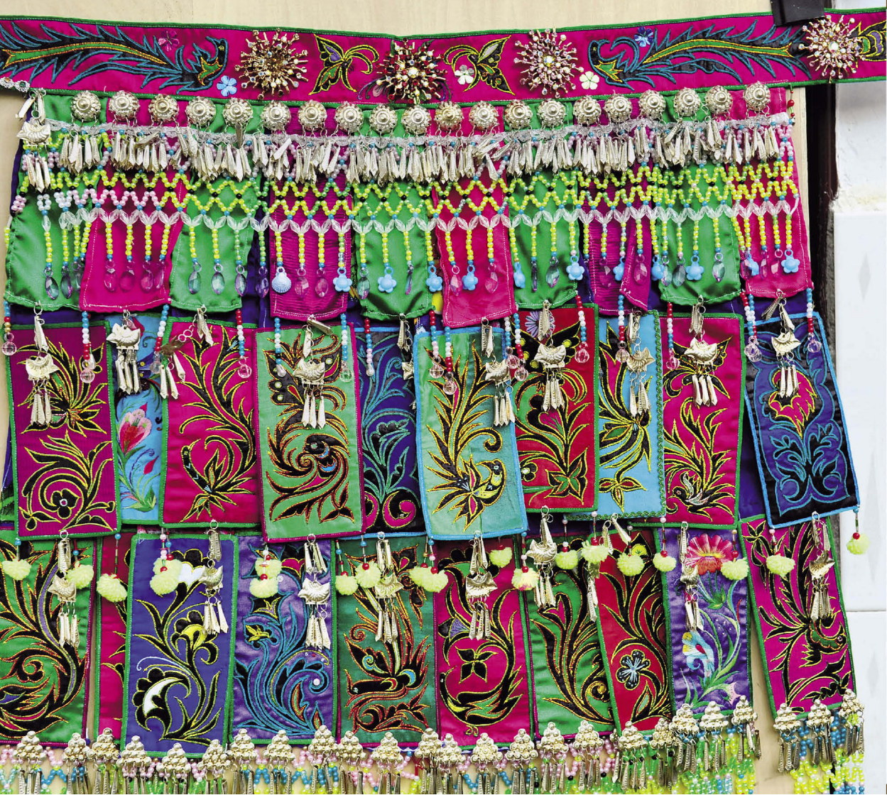
广南县耆太男性腰带绣锦

广南县壮族的“弄娅歪”武术队，皆为男性，每逢节庆表演，都系上绣有这种围腰带绣锦。自称“濛依”的壮族，“濛依”的壮语原意为“人鸟”，即“鸟人”。现山卡子岩画“鸟形男人”，是壮族先民鸟崇拜的记载和见证，壮族崇拜鸟，男性腰带绣锦饰有鸟图案。