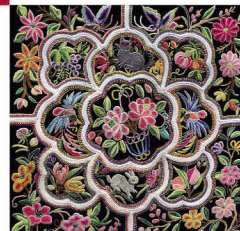
近代壮锦背带飞蝶、花卉同构图（组图）