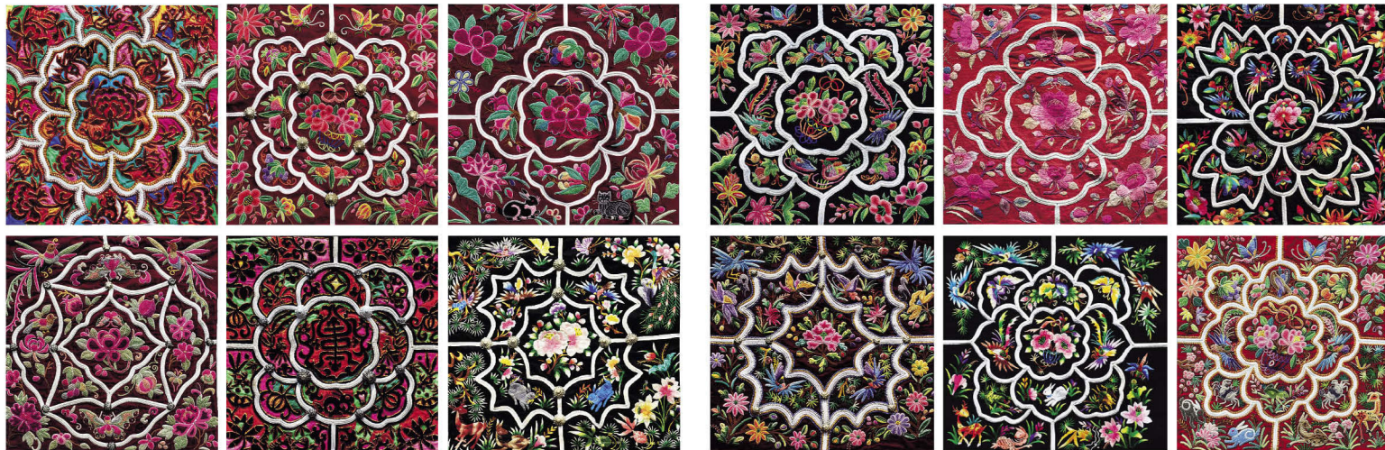
广南县壮族濮依支系绣样(组图)