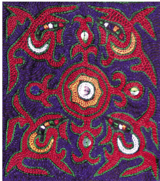
壮族土支系“布德”服饰上的四鸟异日图