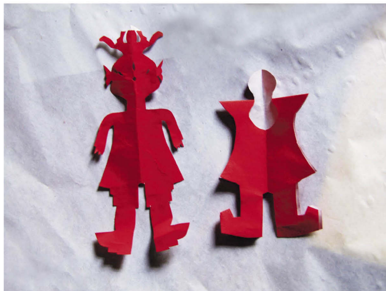
壮族女祭司剪纸作品“纸人”