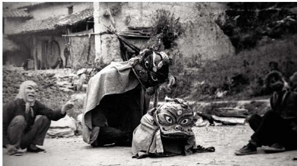
西畴县下坝村20世纪80年代时的“娅歪”面具舞

壮语“娅歪”，意译“娅”为“女性、母”；“歪”即“水牛”，“娅歪”可译为“母水牛”或“祖母牛”。壮族崇拜水牛，早在石器时代，壮族先民就与水牛结下深厚的情缘。在文山州境所发现的岩画上，壮族先民都绘有水牛岩画。从远古到近代的几千年，水牛陪伴壮族人民生活发展，可以说壮族人民离不开水牛，