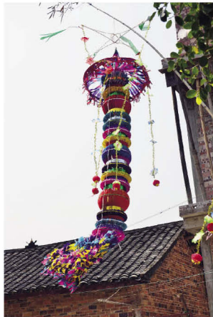
举行葬礼时悬挂的剪贴——“大钱”

壮族原始摩教认为，人活着有十二魂，死后还有三魂，一魂在墓地守尸，一魂在宗族神龛保佑后裔，一魂另投身变成人或动物。人生病，认为魂离开人体，需请“包满”或“博摩”祭司举行招魂仪式，需剪纸人代替魂魄或告慰灵魂。