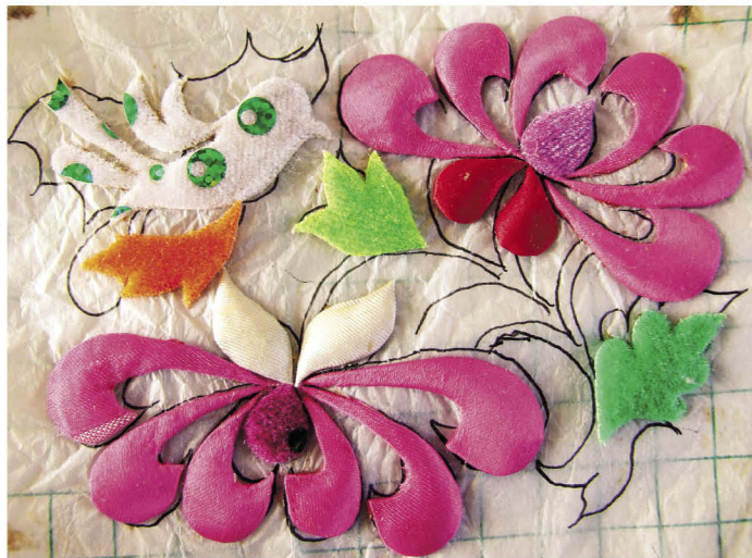
①②③④⑤⑦⑧⑨⑩ 壮族濮依支系穿贴图 ⑥ 壮族妇女制作穿贴