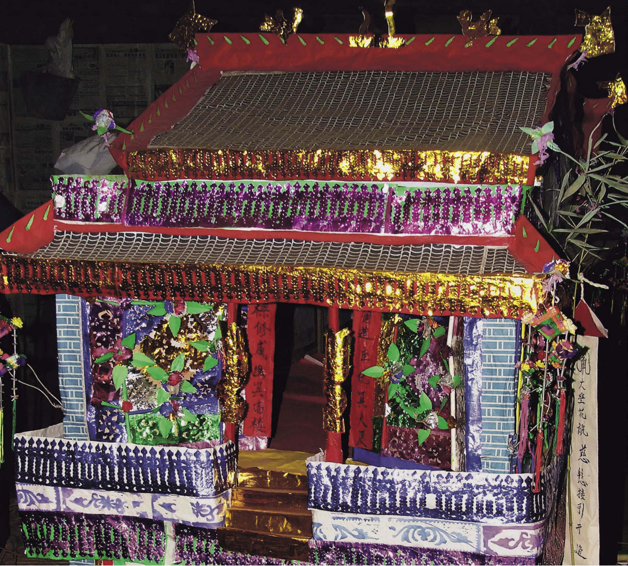
社族灵房剪纸，社语称“忌楼”